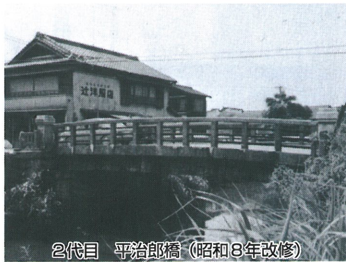
2代目 平治郎橋（昭和8年改修）