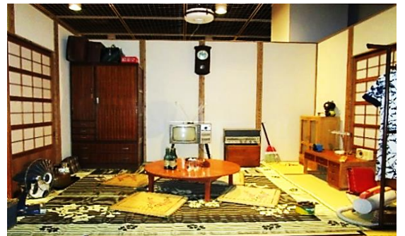
展示風景 (イメージ)

昭和の道具を見直すことで「心の豊かさやくらしの便利さとは何か」を問い直し、「いまのくらし」を見つめ直してみませんか。