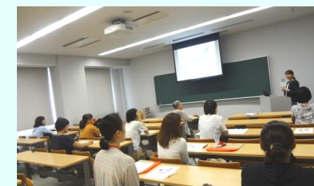
昨年度の受講風景