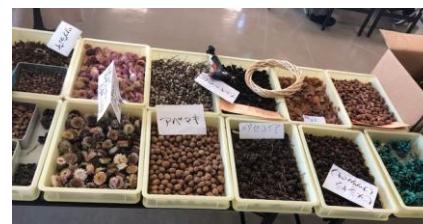
どの材料を選ぼうかな？