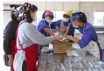
中学生も参加したアルファ米の炊き出し