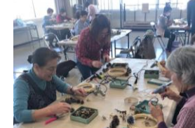
どんなリースができるかな？