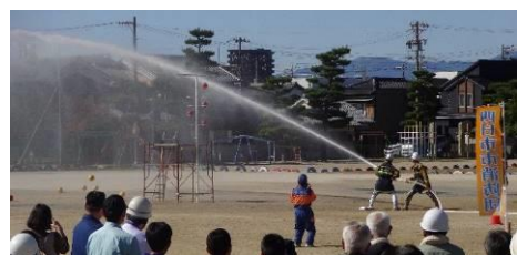
消防分団による放水訓練

津波を想定した津波避難ビルへの避難訓練を行い、その後小学校に集合し、防災に役立つ訓練を体験しました。今年は伊勢湾台風から60年の節目の年であり、多くの参加者が伊勢湾台風のDVD映像に見入っていました。