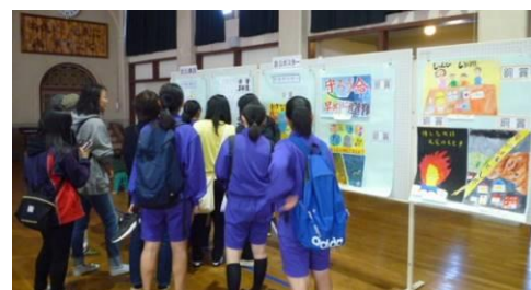
防災標語・防災ポスター