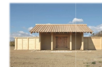
久留倍官衙遺跡の八脚門(復元)

詳しくは、『広報よっかいち』6月下旬号、久留倍官衙遺跡公園ホームページ ( http://www.city.yokkaichi.mie.jp/kyouiku/kurube )をご覧ください