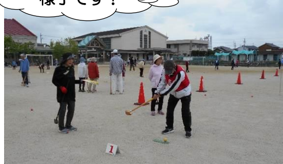
当日の大会の様子です!