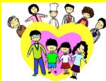
里親は子どもの育ちの応援団

様々な理由で保護者と一緒に暮らせない子どもたちと泣いたり笑ったり・・・このような子どもを家庭へ迎え入れ、温かい愛情をもって育てていただいている「里親」さんたちのお話を聞いてみませんか。里親説明会 in 四日市を開催します！