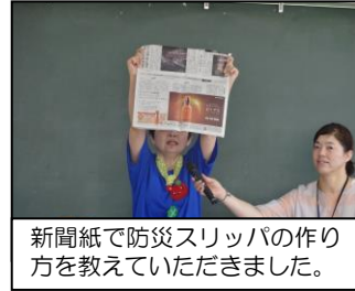
新聞紙で防災スリッパの作り方を教えていただきました。