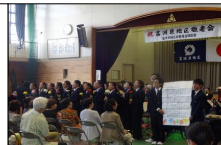
白子高校吹奏楽部によるパフォーマンスと素敵な演奏