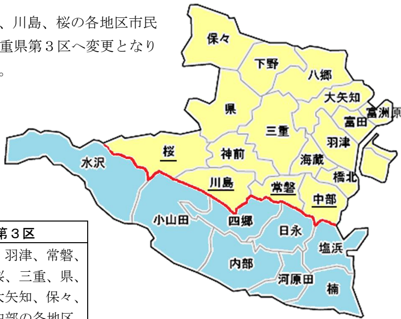
【改定後】衆議院小選挙区図

衆議院議員選挙の1票の格差を是正するため、公職選挙法が改正されました。この法改正により、三重県内の衆議院小選挙区の数はこれまでの5区から4区に減少し、県内の区割りの見直しが行われました。四日市市内においても、中部、常磐、川島、桜の各地区市民センター管内は、三重県第2区から三重県第3区へ変更となりました。投票する際はご注意ください。