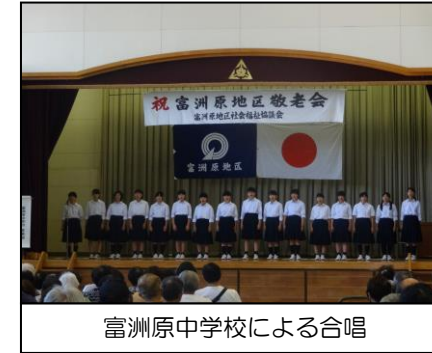
富洲原中学校による合唱