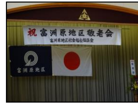
富洲原地区社協会長の挨拶

最後にお楽しみの抽選会もあり、今年も楽しいひとときを過ごされました。皆様、いつまでもお元気で！