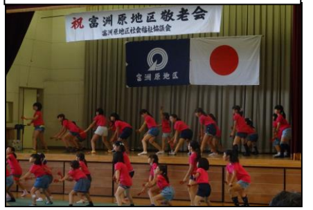
北部児童館の子供たちによるパフォーマンス