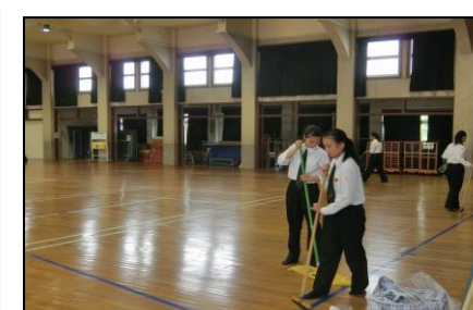
敬老会開催後の後片付けを、白子高校の皆さんが手伝っていただきました。ありがとうございます。