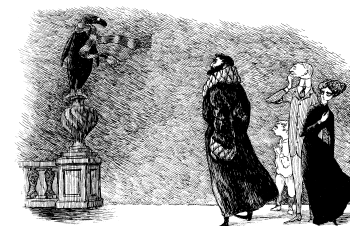
『うろんな客』原画 1957年

不思議な世界観と、モノクロームの緻密な線描で、世界中に熱狂的ファンをもつエドワード・ゴリー。貴重な原画・書籍・資料など約300点を展示し、ゴリーの多彩な制作活動にみる、謎に満ちた優雅な秘密に迫ります。