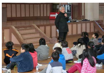
自主防災隊長のお話