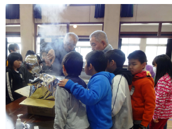
アルファ米の炊き出し