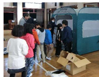
プライベートルームの中を見学