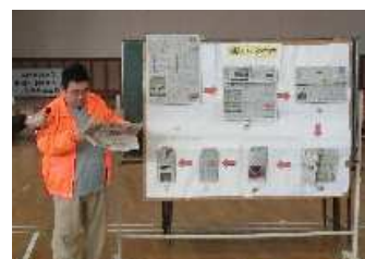
新聞スリッパの作り方を聞いて、スリッパづくりに挑戦!