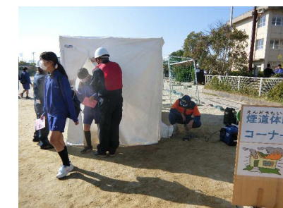
煙道体験コーナー