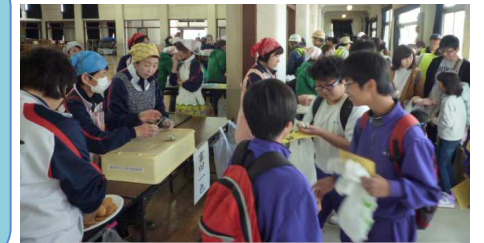
アルファ米とリッツの試食