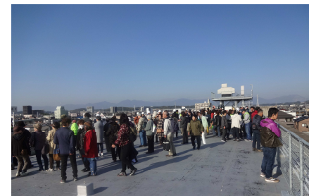
大勢の人が中学校・小学校屋上へ避難!