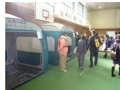
プライベートルーム