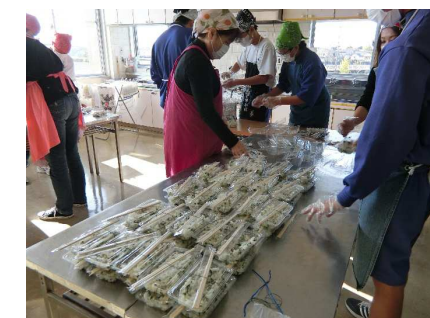
婦人会部・中学生によるアルファ米の炊き出し訓練