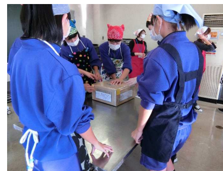
中学生も多数参加!