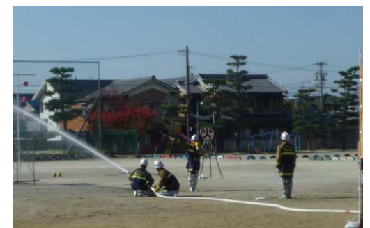
富洲原消防分団の放水訓練