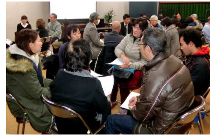
2/5 (金) 松原

3地区の公会堂で人権懇談会が行われました。DVD「ヒーロー」を鑑賞した後、グループに分かれて話し合いました。