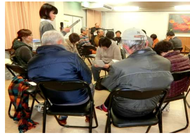
1/29 (金) 天力須賀