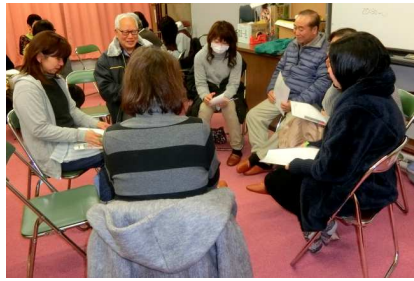
1/22 (金) 富田一色