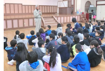
自主防災隊長のお話

隊長の挨拶の後、自主防災隊や消防分団の方々に教えてもらいながら、アルファ米の炊き出しや新聞紙スリッパの作成、簡易トイレやプライベートルームの組み立て訓練を行いました。最後に皆でアルファ米を試食し、盛りだくさんの訓練でした。「アルファ米美味しかったよ」「家族のスリッパも作ったよ」「初めてプライベートルームに入ったよ」など子どもたちにとって貴重な体験となった研修でした。