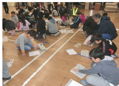
新聞スリッパの作成