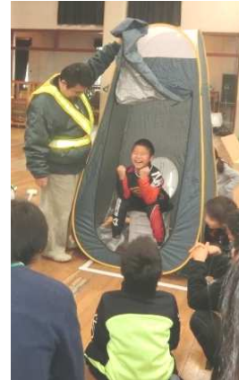
簡易トイレの組み立て