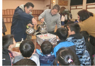
アルファ米の炊き出し