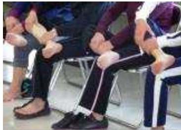
ふくらはぎマッサージ