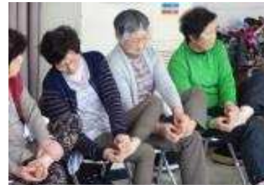
足うらマッサージ