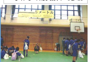
水位5メートルを確認