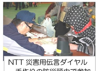
NTT 災害用伝言ダイヤル 手作りの防災頭巾で参加