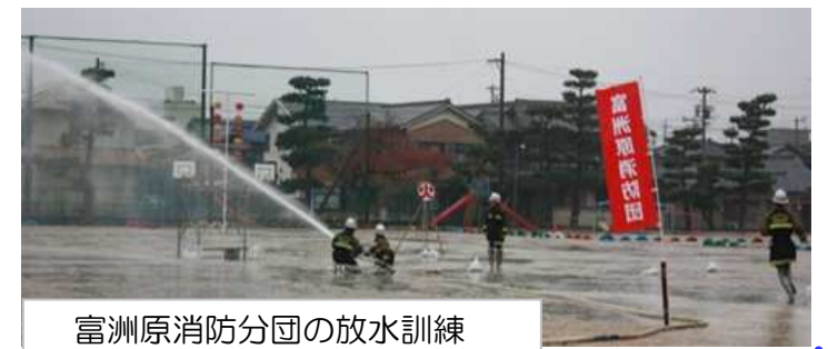
富洲原消防分団の放水訓練