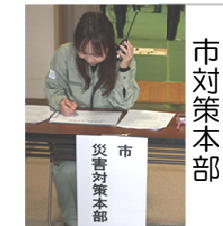
市対策本部 災害対策本部