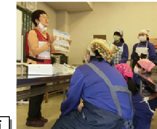
各地区婦人会(部)・中学生によるアルファ米で炊き出し訓練