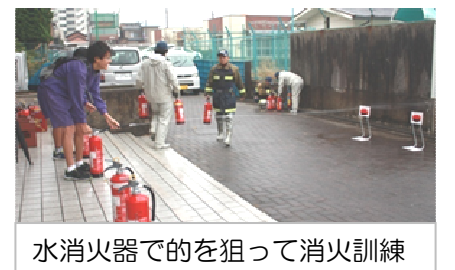
水消火器での的を狙って消火訓練