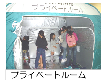
プライベートルーム