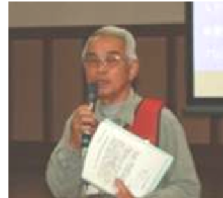
連合自主防災隊長挨拶