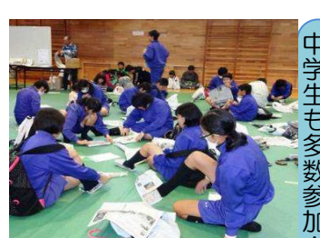
新聞紙スリッパ作成