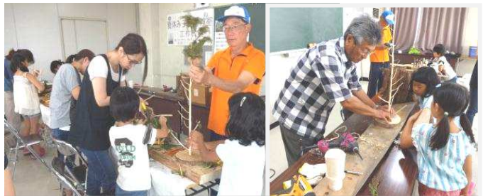
土台に枝を取り付けて、ステキなツリーが完成！

土台には、まきの木を使い、ペーパーで力を入れて綺麗に磨き、接着剤とビスで皮をむいた枝をつけ、完成するとツリーにストラップ・アクセサリ・帽子等をかけて利用できると子どもたちはとても嬉しそうで、自然の木とふれあい楽しい工作教室した。