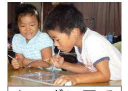
シャボン玉で虹づくり