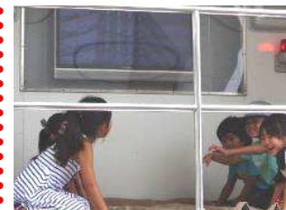
地震体験車で震度6弱を体験