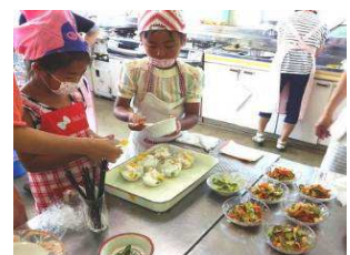
きれいに盛り付けて完成。「いただきま〜す！」