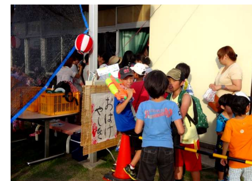
児童館・社協 保健体育部主催の「おばけやしき」中から、「キャー!!」という悲鳴が・・・。