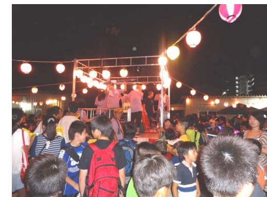
抽選会も大盛り上がりでした。