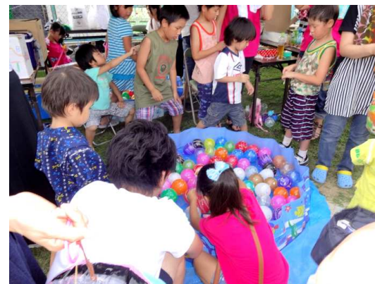
手作り夜店で楽しみました。