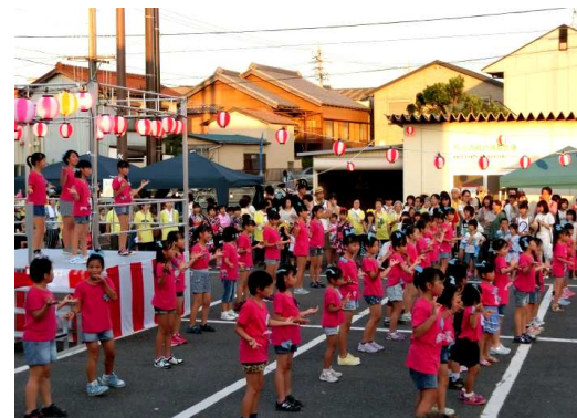
子どもや老人会・飛鳥・フォークダンスサークル「スマイル」の皆さんが元気に踊りを披露してくれました。