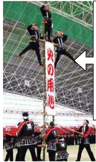
この「はしご」を作ります。