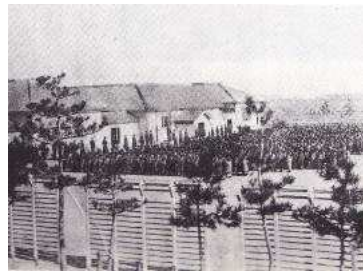
富洲原尋常小学校校庭