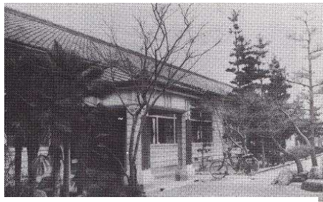
昭和初期の富洲原小学校校舎玄関