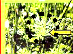
葉の付け根が茎を抱き込んでいません