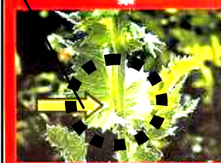
葉の付け根が茎を抱き込んでいます